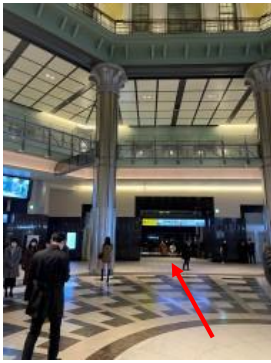
① JRの丸の内南口の改札を出てください。