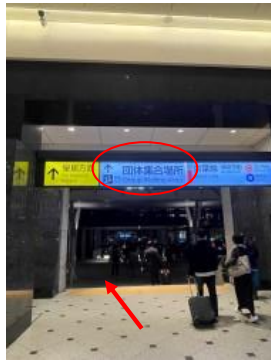
② 改札をでたら、まっすぐ進みます。