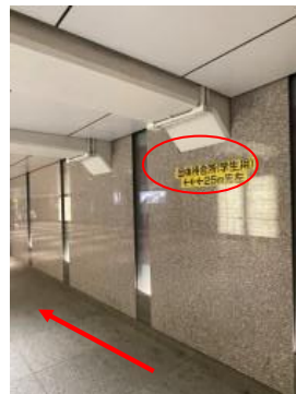
⑤ 階段を下りて、まっすぐ進みます。