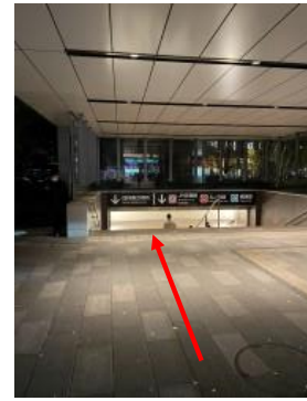
③ 外に出ると、地下へ繋がる階段があります