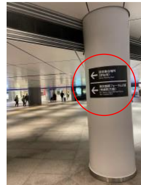
⑥ 左手に団体待合所があります。